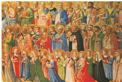
Fra Andželiko. Visi svētie. 15. gs. Nacionālā galerija Londonā.

robežas ķelti svinēja Pļaujas svētkus, kas iezīmēja lauksaimniecības gada beigas un jauna gada sākšanos. Samhain – mēnesis, kas iesākās mūsdienu oktobra beigās – novembra sākumā, ķeltiem bija ziemas jeb tumšā pusgada sākums, laiks, kas saistīts ar nāves un aizkapa tēmu. To sagaidot, visu nakti tika dedzināti ugunsķūri, lai paturētu gaismu kaut mazliet ilgāk un lai atvaļinātu ļaunos garus, kam, pēc ķeltu ticējumiem, nu bija dota pilna vaļa plosīties virs zemes. Cilvēki pārgērbās par mošķiem un raganām, lai, trāpoties tiem ceļā, tiktu noturēti par savējiem, citādi – ej nu zini, ko šie var nodarīt! Svētku naktī arī mirušie drīkstējuši atgriezties virs zemes, lai paviesotos pie vēl dzīvajiem savējiem. Viņiem svētku mielasts tika izlikts ārpusē pie mājas.